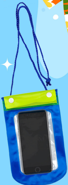
ซองกันน้ำ