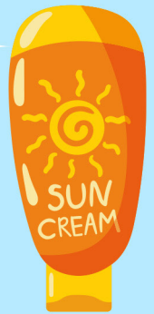
ครีมกันแดด