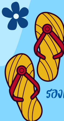
รองเท้าแตะ