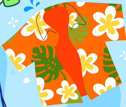
เสื้อผ้าดอก