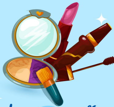
เครื่องสำอางกันน้ำ