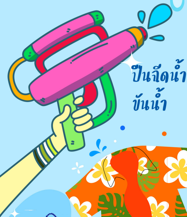
ปืนฉีดน้ำ ขันน้ำ