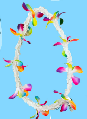
สร้อยคอดอกไม้